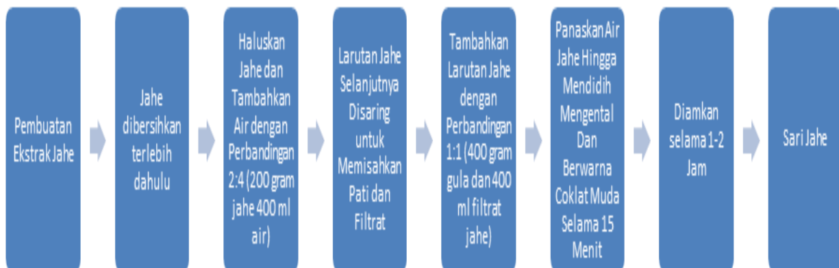
Gambar 1. Proses Pembuatan Ekstrak Jahe

Proses pembuatan ekstrak jahe dilakukan dengan beberapa tahapan, selengkapnya dapat dilihat pada diagram berikut: