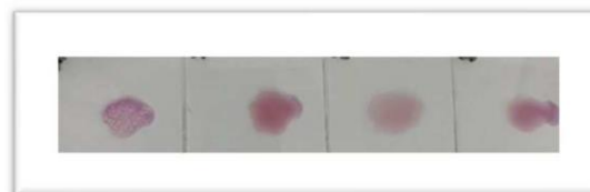
Gambar 1. Hasil Pengujian RBT Sampel Serum Darah Sapi

Pemeriksaan sampel negatif pada Uji RBT ditandai dengan tidak terdapat butiran atau endapan pasir seperti kontrol positif (Gambar 1 dan Gambar 2) yang menandakan sapi dan kambing yang di uji bebas dari penyakit brucellosis .