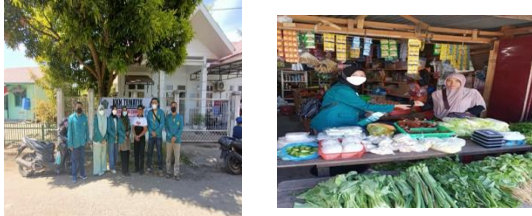
Gambar 2. Pemasangan spanduk dan pembagian masker