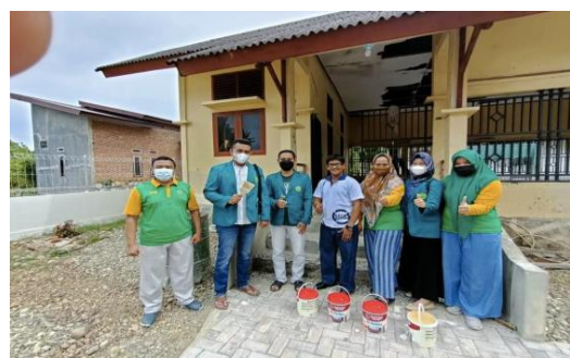
Gambar 4. Pengecatan Balai Pengajian

Memperhatikan kondisi/keadaan balai pengajian yang relatif kurang menggembirakan dikarenakan cat dindingnya sudah lama tidak ada pembaharuan, disamping juga berbagai fasilitas yang tersedia masih terbatas, termasuk kekurangan kitab suci Al-quran, dimana banyak anak-anak yang ikut pengajian di TPA tersebut. Karena itu, balai pengajian tersebut memerlukan dukungan dan bantuan dari berbagai pihak, termasuk dari kalangan mahasiswa yang mengabdikan kepada masyarakat. Melaksanakan pengecatan balai pengajian serta penyerahan kitab suci al-quran kepada pimpinan atau kepala balai pengajian. Pada kegiatan ini, yang menjadi tempat kegiatan yaitu TPA Gampong Lamjame. Kegiatan pengecatan balai pengajian, pembersihan tempat wudlu, dan penyerahan kitab suci al-quran mendapat sambutan positif dari pimpinan/kepala pengajian. Harapannya, semoga kegiatan tersebut bermanfaat bagi santri yang menimba ilmu di balai pengajian tersebut. Lebih lanjut, mereka juga berharap kegiatan serupa atau dalam bentuk lainnya dapat ditingkatkan lagi di masa mendatang.