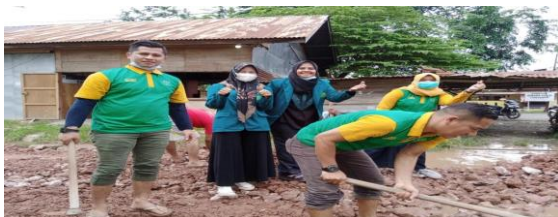
Gambar 3. Penimbunan jalan utama Gampong

Pada kegiatan ini, penimbunan jalan utama menuju akses desa berjalan lancar tanpa adanya kendala. Menariknya, dalam kegiatan penimbunan jalan utama gampong tersebut, turut berpartisipasi dan berperan aktif dari kalangan Koramil dan Polsek setempat, serta masyarakat Gampong Lamjame.